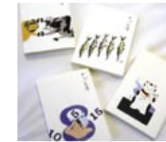
選ばれた作文を掲載 したざぶん庫。 アート作品が表紙の カバーになります。

応募方法/一般の原稿用紙、またはA4用紙に、濃い鉛筆、ボールペンを使用。 題名、名前(ふりがなも)、学校名、学年、性別、連絡先住所(郵便番号も)、電話番号、 学校からの応募は、担当の先生のお名前を明記し、郵送または電子メールで。 (電子データで送られる場合は、原稿野線を用いないワード形式のデータを添付し、 件名を「ざぶん賞応募作品」として送付してください) 締め切り/2012年9月10日(月)必着 郵送/〒920-0362 石川県金沢市古府1-197 ざぶん賞実行委員会事務局まで 電子メール/info@zabun.jpまで