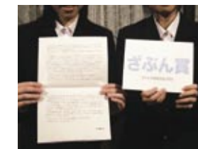
応募者全員に贈られる認定証。 それぞれの応募作品が編集され、挟み込まれています。

応募者全員に「ざぶん大使認定証」を発行。 選ばれた文章は各賞になり、画家の西のぼる氏、原田維夫氏、百鬼丸氏、蓬田やすひろ氏、 工芸作家の林香君氏、その他イラストレーターや工芸作家がアート作品に仕上げ、贈呈。 賞/ざぶん大賞、準大賞、環境賞、文化賞、特別賞など数点 文章選考/作家 安部龍太郎氏、森まゆみ氏 発表、表彰式/2012年11月予定